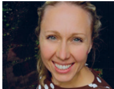
Axana freut sich auf eine rege Teilnahme!

Das Fitness-Studio Chace aus Kaltenkirchen bietet zur Woche der seelischen Gesundheit einen 1-stündigen kostenfreien Schnupperkurs an, in dem mit Musik und Freude die Beweglichkeit, Koordination und das Gleichgewicht trainiert wird. Am Ende steht eine kleine Entspannungseinheit an. Die Form dieses Sportes nennt sich Agility-Stretch. Sie ist geeignet für Jung und Alt, für Anfänger und „Profis“.